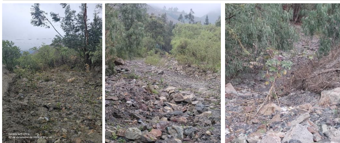
FOTOGRAFIA 02: Vista en la que se aprecia la carencia de diques secos con acumulacion de material propio en ambas margenes del río.