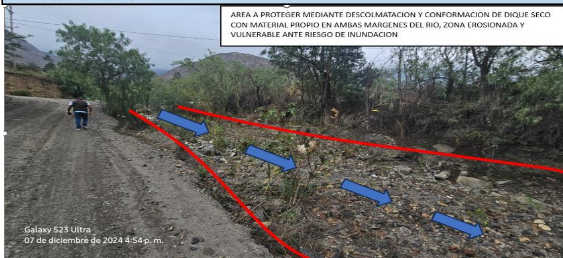
FOTOGRAFIA 01: Vista en la que se aprecia el cauce del río el cual se encuentra colmatado, producto de las avenidas extraordinaria.